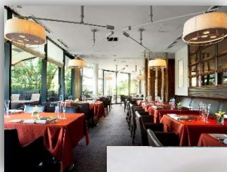
ラ・テラス イリゼ ※イメージ