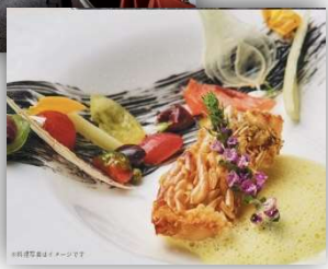
※伊勢屋製菓イメージです